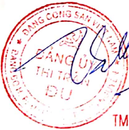
TM. BCH. ĐẢNG BỘ TT. ĐU BÍ THƯ HÀ LONG THỦY